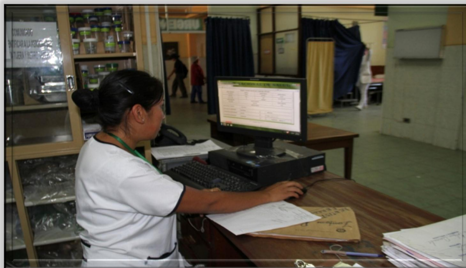
Sistema Urgencias Servicio de Urgencias Hospital Obrero N° 2.

Implementación del Sistema Informático de Recursos Humanos, desarrollado por la Jefatura Regional de Sistemas.