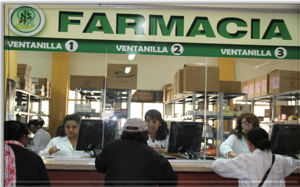
Ventanilla Farmacia Atención al cliente Policlínico M.A.V. N° 32