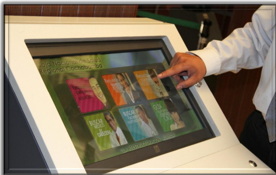
Sistema Plataforma de Atención al Cliente (Asegurado)