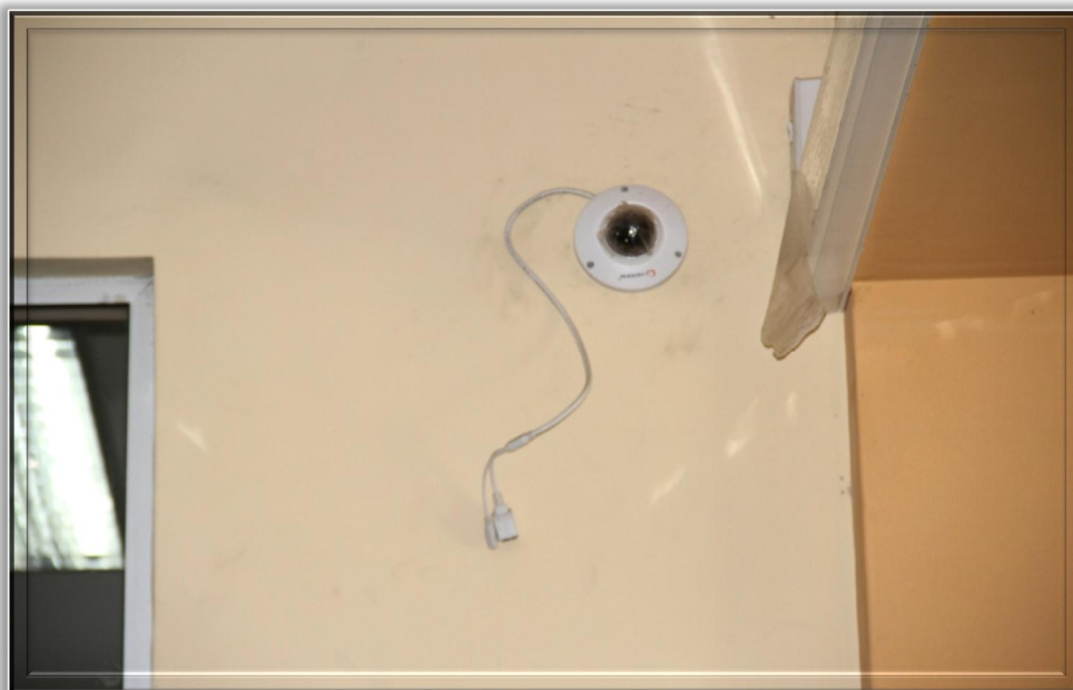
Cámaras tipo A (Tipo Domo Interior)