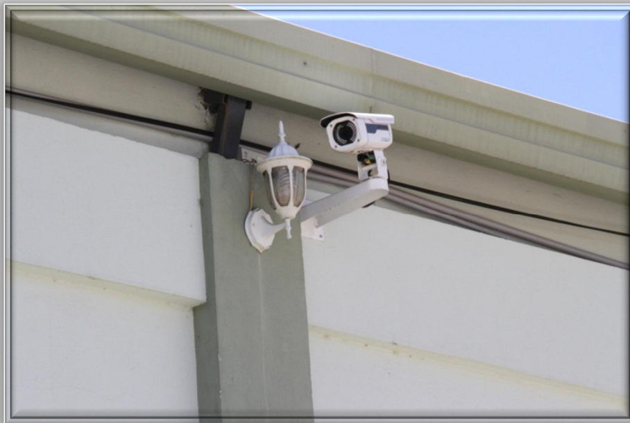
Cámaras tipo C (Tipo Boulet)