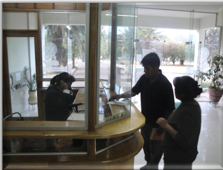
Teléfono IP Tipo Operadora Plataforma Hospital Obrero N° 2