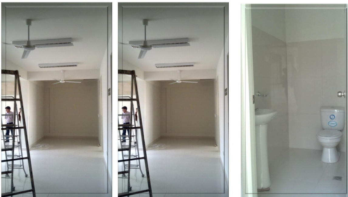
Construcción de Consultorios en Centro de Salud Punata